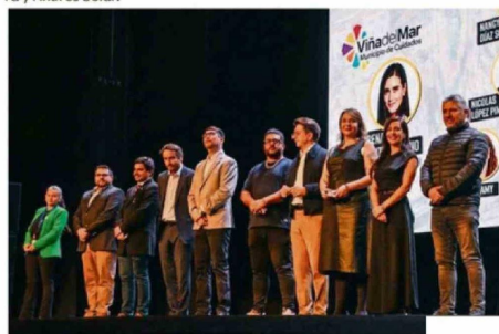
Concejo Municipal junto a representantes del Cosoc y del Consejo de Seguridad Comunal.