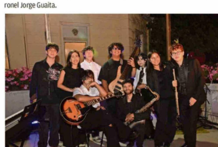
Ensamble de Jazz de la Escuela Comunitaria de Artes de Viña del Mar.