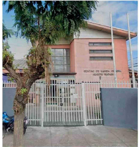
EL ELEAM DE HUALPÉN cuenta con identificación y seguimiento de residentes en riesgo de desorientación.