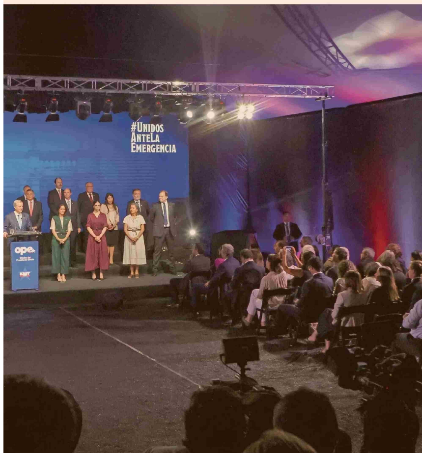
El Presidente electo junto con su gabinete de 24 ministros, en la sede de la OPE en calle La Gloria, en Las Condes.