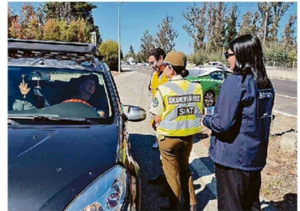
SE INTENSIFICARÁN LOS CONTROLES EN LAS CARRETERAS.

"La oferta es variada, todas las comunas y destinos tienen preparadas actividades, como la Feria Sobre mesa en tantes, o el consumo que tengan en esos días, pero apostamos a que esto no nos afecte más de un 4 a 6% en los próximos fines de semana".