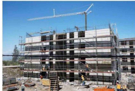
EL DÉFICIT HABITACIONAL SIGUE SIENDO UNO DE LOS PRINCIPALES DESAFÍOS EN CHILE.

A nivel país, la Región Metropolitana concentra el 42% de los requerimientos habitacionales, con 348.610 viviendas,