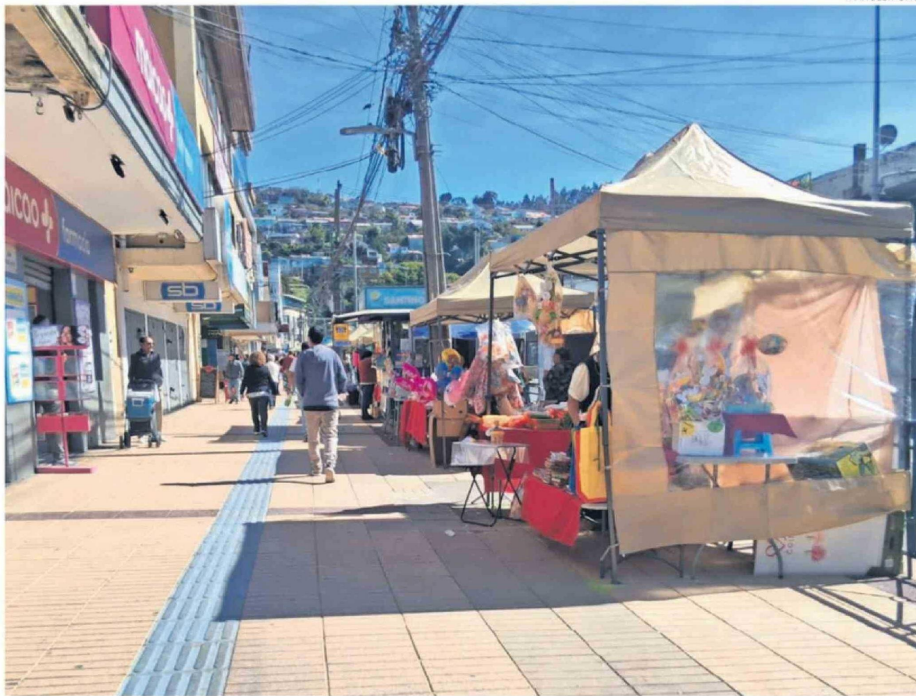
ESTE TIPO DE TOLDOS Y DISPUESTOS EN ESPACIOS DELIMITADOS, ES LO QUE SE PERMITE DESDE AHORA EN AV. COLÓN EN TALCAHUANO.