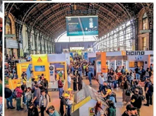
El encuentro de formación refleja un esfuerzo permanente de Sodimac a través del Círculo de Especialistas, que con 21 años hoy tiene más de 1.040.000 miembros.

La decimocuarta versión de la Gran Feria de Capacitación de Sodimac entregó más de 71 mil capacitaciones gratuitas en formato presencial y digital, superando las poco más de 60 mil de 2025, con foco en fortalecer la productividad y ejecución de proyectos en el sector construcción.