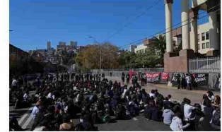
Participaron en la movilización, estudiantes de liceos emblemáticos y de la Pontificia Universidad Católica de Valparaíso (PUCV), la Universidad de Valparaíso (UV) y la Universidad de Playa Ancha (UPLA).