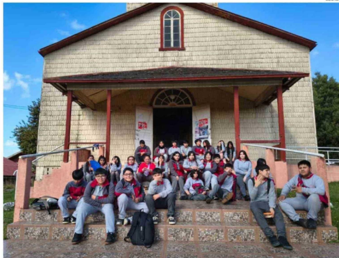
EL TALLER ES VOLUNTARIO Y HA DESPERTADO EL INTERÉS DE MUCHOS ESTUDIANTES DEL COLEGIO DE RIACHUELO.

"Llevo ocho años investigando en la comuna de Río Negro. La información, los relatos orales que he ido recopilando y todo el trabajo realizado en este tiempo, ahora comienzo a traspassarlo. La idea es que esto se implemente en los colegios, que es lo importante, y principalmente en el Colegio de Riachuelo, porque cuenta con ni-