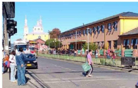
LOS MENORES FUERON EVACUADOS DE LA ESCUELA.

se suspendieron las clases hoy para avanzar en la regularización de las condiciones, mientras que el viernes se actualizaría la información sobre el retorno a clases.