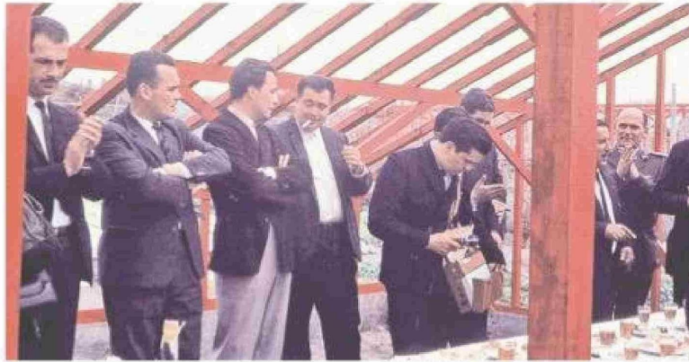
Inauguración de invernaderos en Punta Arenas en 1966 con créditos facilitados por el Instituto de Desarrollo Agropecuario (Indap).