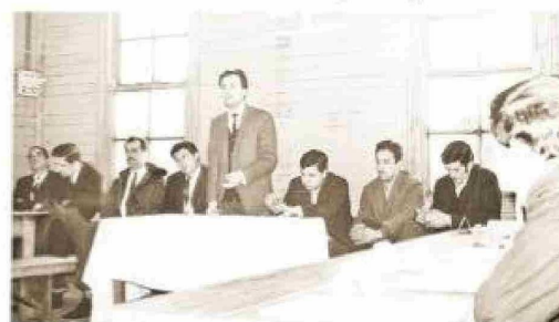
Inauguración de una capacitación campesina en el asentamiento Cacique Mulato en 1967.

El amplio trabajo desplegado por Nicolo, pronto encontró un nuevo estímulo. El 16 de julio de 1967 se promulgaron las leyes N° 16.625 de Sindicalización Campesina y la N° 16.640 de