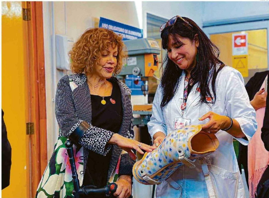
LA MINISTRA PAROT VISITÓ AYER EL INSTITUTO TELETÓN DE VALPARAÍSO Y COMUNICÓ EL COMPROMISO DEL GOBIERNO CON EL PROYECTO.

La directora general agregó que "queremos tener mayor accesibilidad, que nuestros pasillos sean más anchos, poder tener mejores baños, mejor infraestructura, para que esta rehabilitación, que es larga, se pueda entregar de