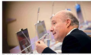
El ministro de Hacienda, Jorge Quiroz, ha advertido sobre una mayor presión fiscal para este año.

drá una mayor presión a las finanzas públicas" generando una mayor emisión de deuda. "Diversos economistas decían que la estimación era demasiado abultada y, por lo tanto, el presupuesto que se estaba desarrollando en base a esa estimación