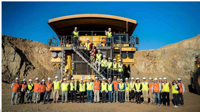
Uno de los principales objetivos de CAP es ser líderes en el mercado global de los materiales para la descarbonización, a través de un portafolio integrado de negocios y el desarrollo de productos y soluciones innovadoras y sostenibles, siempre al servicio de su propósito de crear bienestar y progreso compartido.

"Estos avances son reflejo del compromiso de CAP con un