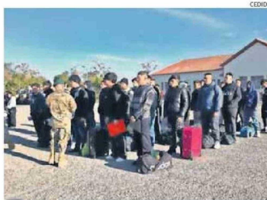
PARTIÓ ACUARTELAMIENTO DE LOS SOLDADOS CONSCRIPTO EN CALAMA.