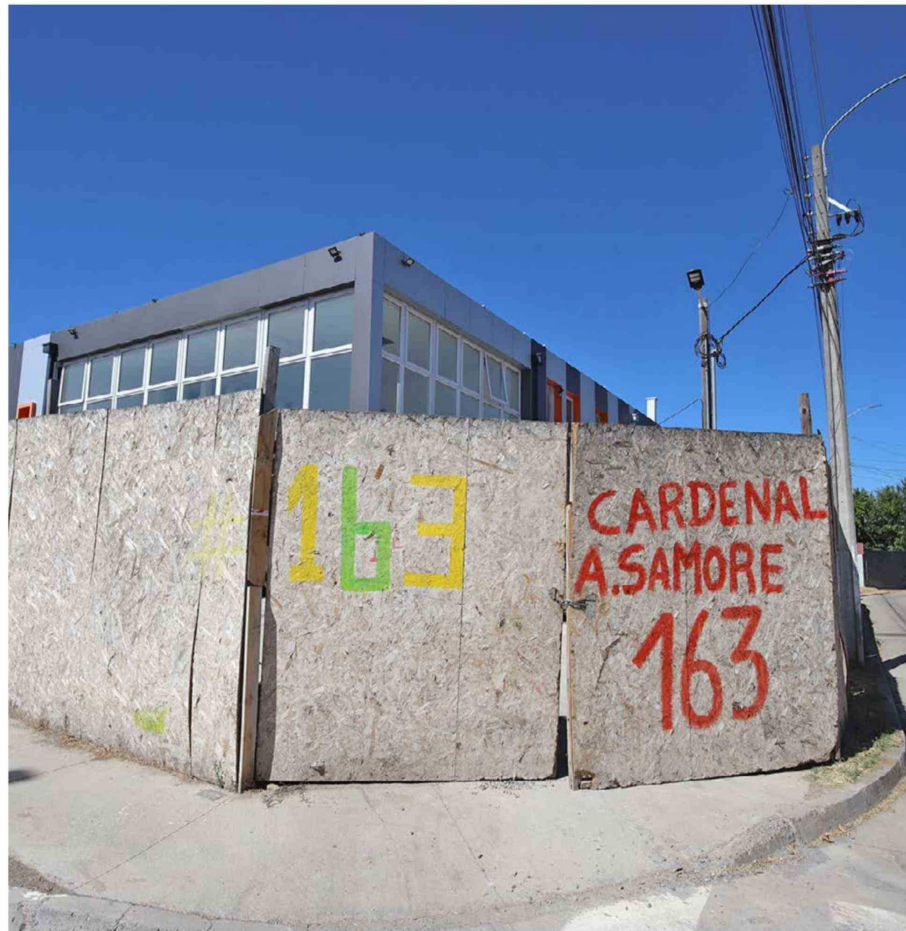
Obras con años de retraso, contratos terminados y avances desiguales marcan la situación de salas cuna y jardines infantiles JUNJI en la Región de O'Higgins.

Posteriormente, en diciembre de 2023, El Rancagüino