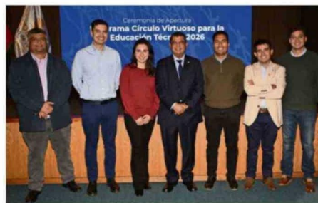
Equipo de Codelco División Ventanas.