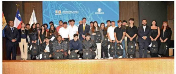
La ceremonia se realizó en las dependencias de la Casa Central de la Universidad Santa María, en Valparaíso.