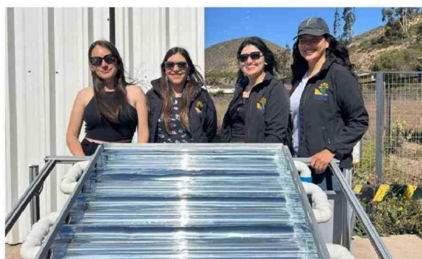
Cazalac, con el apoyo de las universidades Católica del Norte y de La Serena, y el INIA-Intihuasi, desarrolló un tratamiento primario de punta para riles pisqueros.