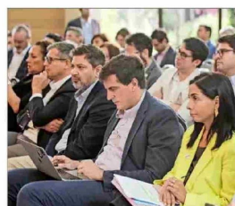
Representantes del mundo público y privado presentaron los paneles y entrevistas de la jornada.

También estuvo presente en la conversación la dimensión productiva: cómo se articulan la academia, las startups, pymes y demás actores. El diputado RN Diego Schalper, articulador de la Banca Startup, puso en la mesa la urgencia de una hoja de ruta compartida, pública y verificable, para lo cual el liderazgo político es central: "Entonces, yo diría (que lo primero es) digitalización del Estado; segundo, es que hay que trabajar por un marco regulatorio; tercero, todo el tema de la educación: capacitación de talento, y fomento al talento. (...) El cuarto lugar es el tema propiamente económico. Si eso se trabaja desde una agencia, si es desde empoderar un espacio en el Ministerio de Hacienda, si es desde Presidencia... lo importante es que alguien aquí tiene que mandar, alguien tiene que conducir".