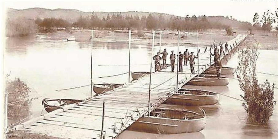
PRIMER PUENTE SOBRE EL RÍO ANDALIÉN, 1929, AÑO EN QUE SE PAVIMENTÓ EL CAMINO A CONCEPCIÓN.