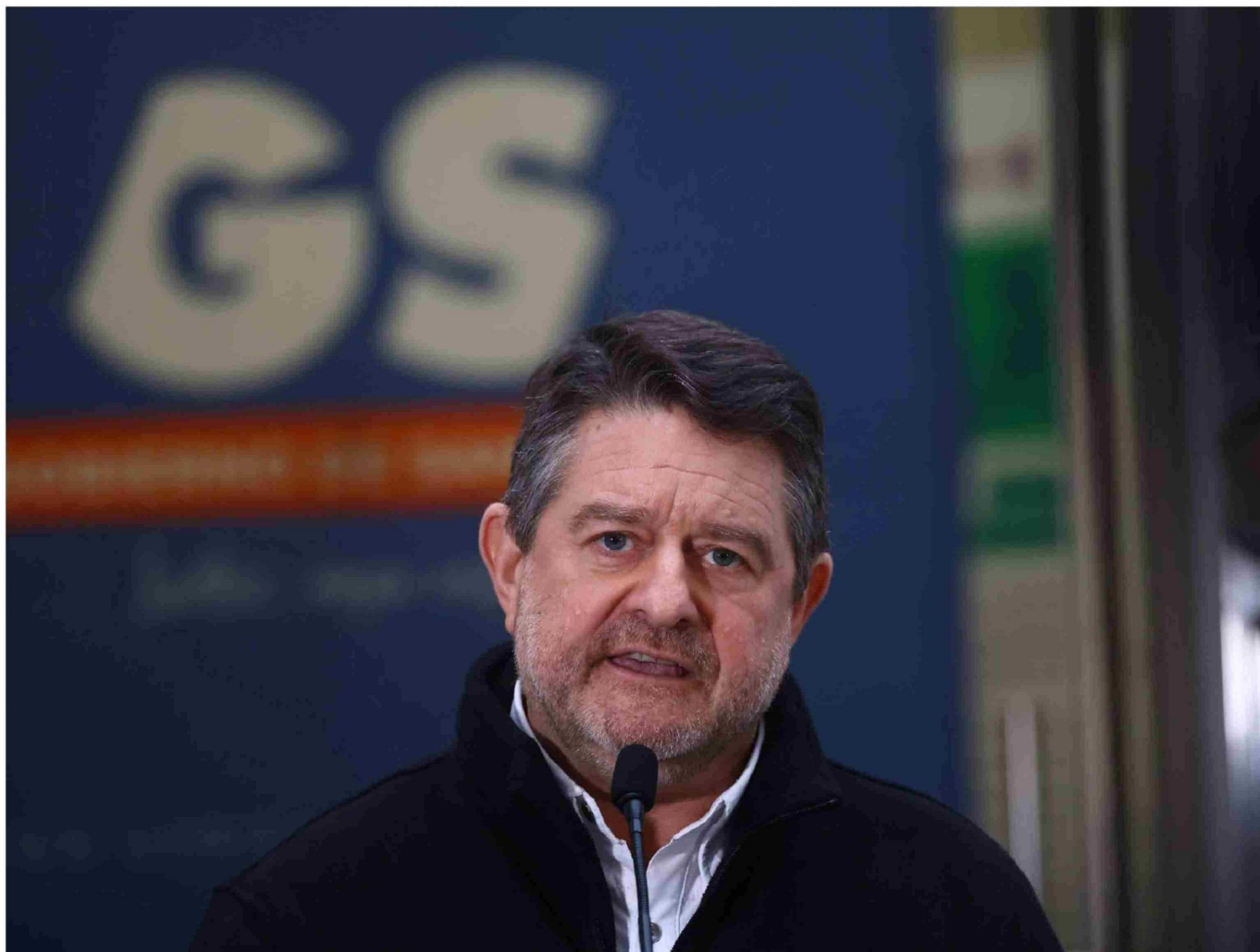
► Claudio Orrego, gobernador de la Región Metropolitana, es investigado por el eventual mal uso de gastos públicos.

Título: Orrego, el imputado: los detalles de las diligencias que complican al gobernador RM