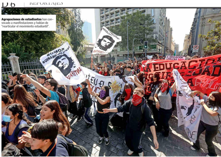
Agrupaciones de estudiantes han convalidado a manifestaciones y hablan de "rearticular el movimiento estudiantil".