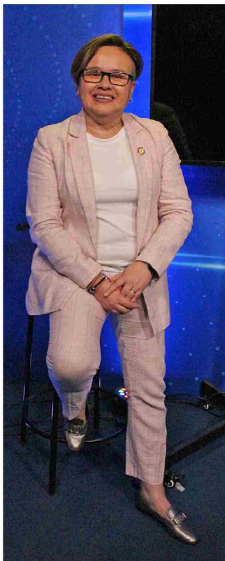
En El Rancagüino TV nos adelantó lo que será su futuro y vuelta a la vida civil.

A PUNTO DE CULMINAR SU PERIODO COMO PARLAMENTARIA, RIQUELME REALIZA UN BALANCE DE SU GESTIÓN DE ESTOS CUATRO AÑOS Y FINALIZA CON UN ANÁLISIS AL ACTUAL ESCENARIO POLÍTICO DEL PAÍS.