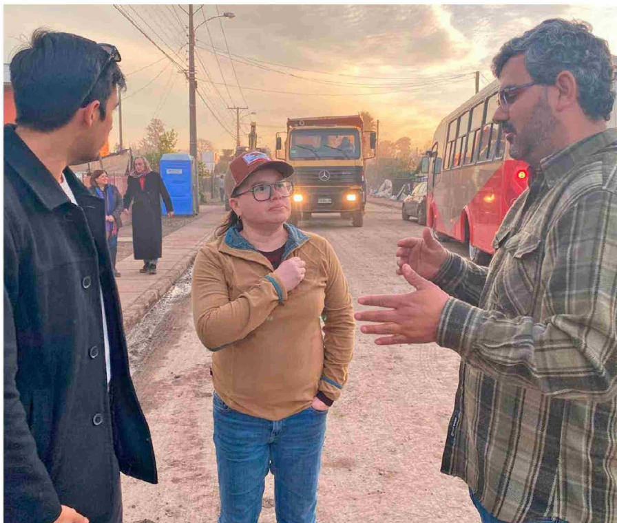
Recordó haber salido más allá de los límites de su distrito y recorrer otros sectores de la región y también el país en su calidad de parlamentaria.