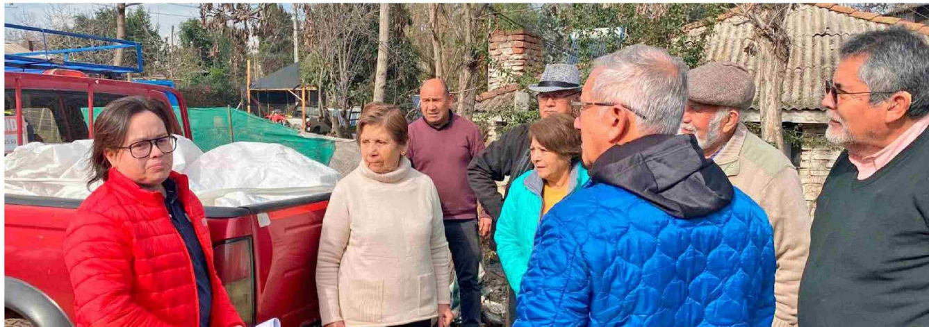
En el marco de cierre de ciclo como legisladora