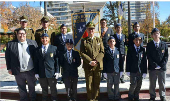
Brigadistas escolares del colegio Moisés Mussa de Rancagua junto al general Guillermo Bohle.