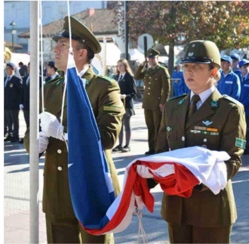
Los estudiantes demostraron compromiso y responsabilidad durante la actividad efectuada en la Plaza de Los Héroes.