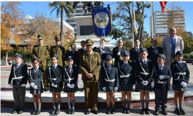
Brigadistas escolares de la escuela El Libertador de Callejones de San Vicente junto al general Guillermo Bohle.

EXTRACTO Remate: Primer Juzgado de Letras de Melipilla, ubicado en Correa N° 490, 2° Piso, Melipilla, en causa rol C-2194-2025, el 02 de junio de 2026, a las 12:00 horas, se rematará la Propiedad correspondiente Departamento N°206 del segundo piso de la Torre B, y Estacionamiento N°16 del primer piso, ambos del Condominio Neokoke, con acceso por calle Nueva Koke N°1102, de la comuna de Rancagua, Región del Libertador Bernardo O'Higgins. El inmueble está inscrito a fojas 100 vuelta N°181 en el Registro de Propiedad del año 2018 del Conservador de Bienes Raíces de Rancagua, de propiedad del demandado Rafael Felipe Cornejo García. Mínimo posturas remate es la suma de $53.658.731.- La subasta se realizará por modalidad de videoconferencia, mediante el uso de plataforma Zoom, en el enlace https://zoom.us/j/3350506705 . Los oferentes interesados que deseen participar en la subasta deberán consignar una garantía suficiente del 10% del mínimo, caución que se verificará exclusiva-