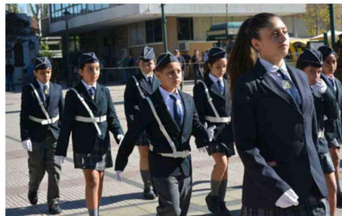
Estudiantes desfilaron y participaron activamente de la ceremonia que destacó valores como la responsabilidad y el trabajo colaborativo.