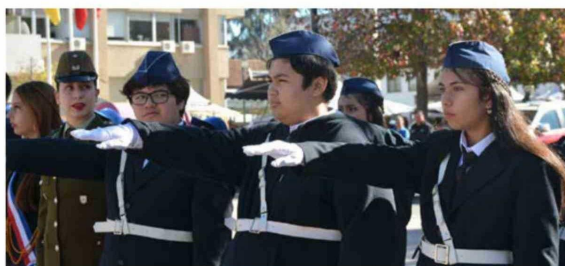
Estudiantes de distintos establecimientos educacionales de la Región participaron del Juramento de las Brigadas Escolares realizado en la Plaza de Los Héroes de Rancagua.

La actividad, cargada de simbolismo, reunió a escolares, docentes, familias y autoridades regionales, quienes fueron testigos del compromiso asumido por niños, niñas y adolescentes