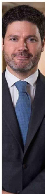
Cristián Muga, presidente de Enap.