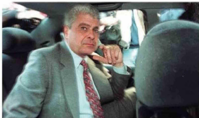
El empresario Alfredo Yabrán se suicidó en mayo, hace 28 años.

El reconocimiento fue interrumpido cuando avisaron que llegaba un hermano del empresario. Los periodistas se escond-