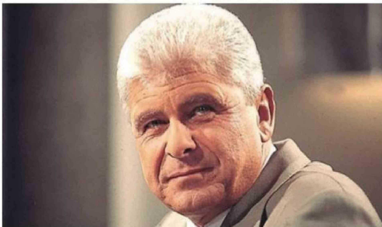
Alfredo Enrique Nallib Yabrán había nacido en Larroque, Entre Ríos, el 1 de noviembre de 1944. Fue acusado de ser el "autor intelectual" del asesinato del fotógrafo José Luis Cabezas.

dias conocían bien a ese muchacho amable y sencillo que andaba de arriba para abajo con el jefe y le franquearon el acceso por el portón enrejado de la calle Pueyrredón, sin sospechar que, acostado en el piso del asiento trasero de una camioneta 4x4, viajaba Don Alfredo. Esa noche Yabrán entró de incógnito a su propia casa.