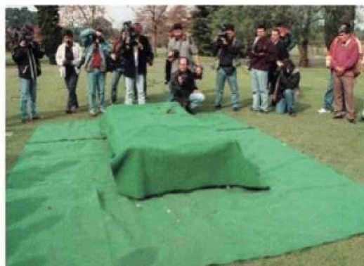
La tumba de Alfredo Yabrán en el Cementerio Parque Memorial de Pilar. El empresario se suicidó a los 53 años.