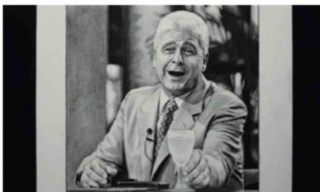
La familia de Alfredo Yabrán se radió en Uruguay luego del suicidio del empresario.