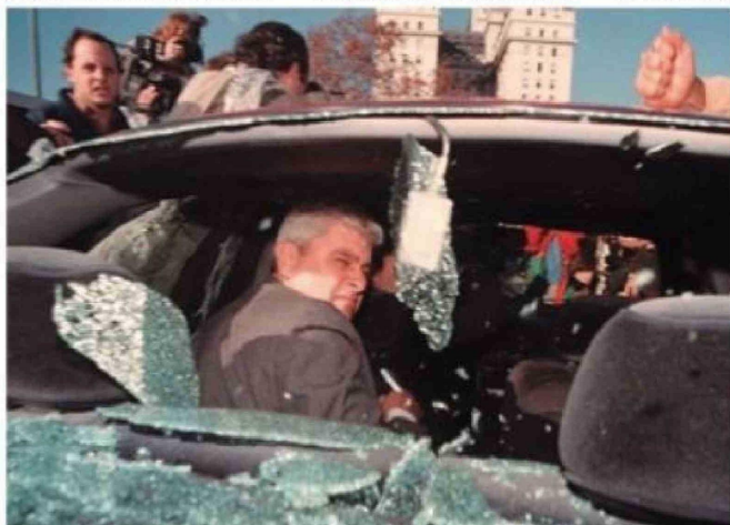
En la foto Alfredo Yabrán, dentro de su auto, luego de una reunión que mantuvo en la Casa Rosada. El vidrio trasero aparece destruido.