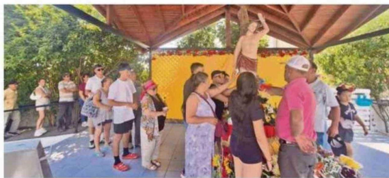
EN PERQUENCO SE VIVIÓ UNA JORNADA DE DEVOCIÓN Y SOLIDARIDAD, HASTA DONDE LLEGÓ EL OBISPO CONCHA DURANTE LA TARDE.