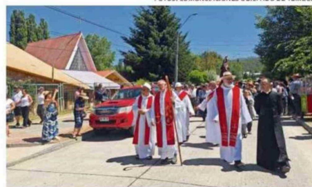
EL OBISPO JORGE CONCHA PRESIDÓ LA MISA CENTRAL EN LONQUIMAY.