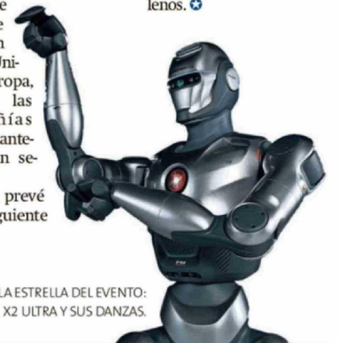
LA ESTRELLA DEL EVENTO: X2 ULTRA Y SUS DANZAS.