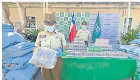
MARIHUANA Y DROGAS SINTÉTICAS TIENEN ALTA DEMANDA.

“Es una evidencia muy potente, y ya nadie puede negarlo, cerrar los ojos o esconder la cabeza. Han pasado semanas y todavía no sabemos cuáles son las medidas que va a delegar para la Macrozona Norte, ni cuáles son las medi-