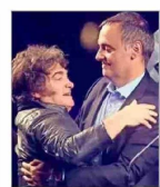
El vocero presidencial, Manuel Adorni, era la ficha más importante del oficialismo.