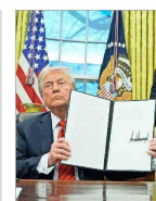
El mandatario republicano, al firmar anoche los decretos.

Casi un millón de viajeros volarán al gigante sudamericano en el primer trimestre. Ofertas de pasajes y depreciación del real, entre las razones del fenómeno. | B8