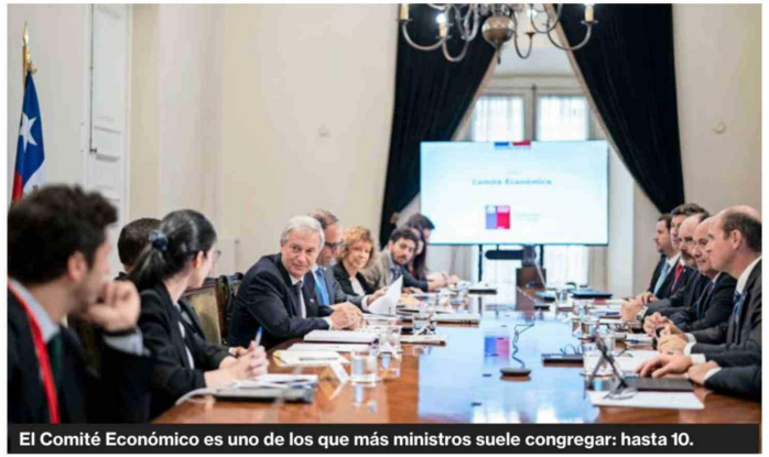
El Comité Económico es uno de los que más ministros suele congregar: hasta 10.