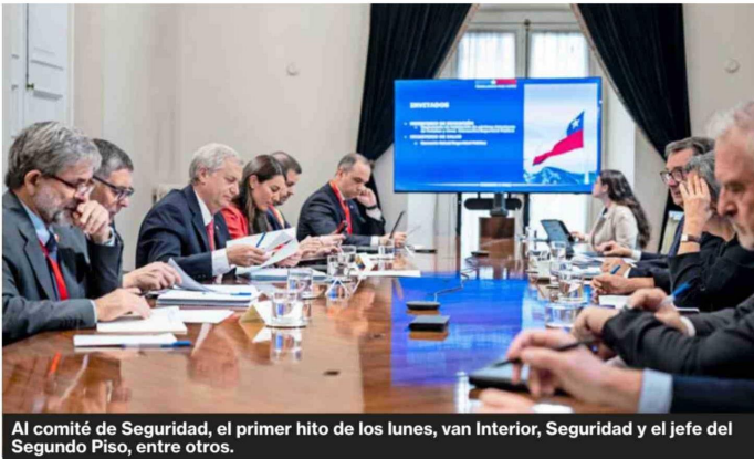
Al comité de Seguridad, el primer hito de los lunes, van Interior, Seguridad y el jefe del Segundo Piso, entre otros.