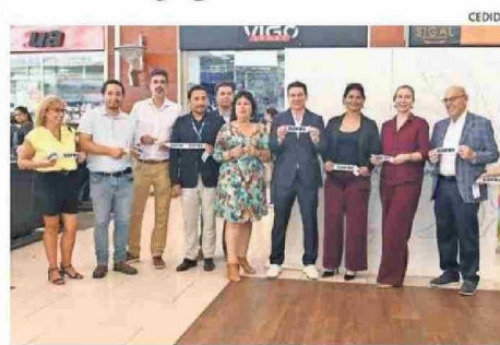
LA EXPO ABORDA EL DESARROLLO DE LA MINERÍA EN EL NORTE DE CHILE.

Esta semana se inauguró la exposición "Huantajaya: El inicio de la minería en Chile", proyecto desarrollado por el Centro Cultural Doña Vicenta, financiado por la Compañía Minera Collahuasi y apoyado por Zofri mediante la facilitación del espacio para su exhibición.