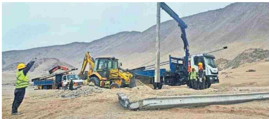
FIRMÓ QUE ROBARON MÁS DE 3 MIL METROS DE CABLEADO ENTRE LA CALETA RÍO SECO Y EL LOA.

Tiraje: 9.500 Lectoría: 28.500 Favorabilidad: No Definida