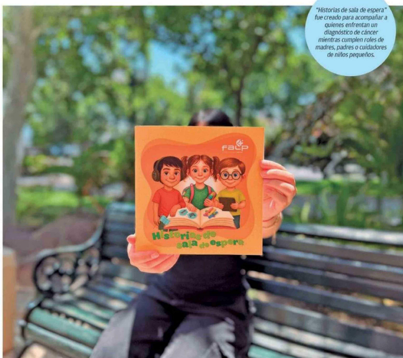
"Historias de sala de espera" fue creado para acompañar a quienes enfrentan un diagnóstico de cáncer mientras cumplen roles de madres, padres o cuidadores de niños pequeños.

Más que enfocarse en cuánto explicar, la especialista enfatiza en la importancia de generar espacios de escucha y mostrar disponibilidad para resolver sus dudas y acompañarlos. Los niños suelen preguntar solo lo que necesitan saber para sentirse tranquilos, y lo hacen por etapas. Por ello, se recomienda utilizar un lenguaje honesto y adecuado a la edad, evitar mentiras o eufemismos confusos, permitir que el niño marque el ritmo de la conversación y reforzar la disponibilidad: "Si tienes dudas o