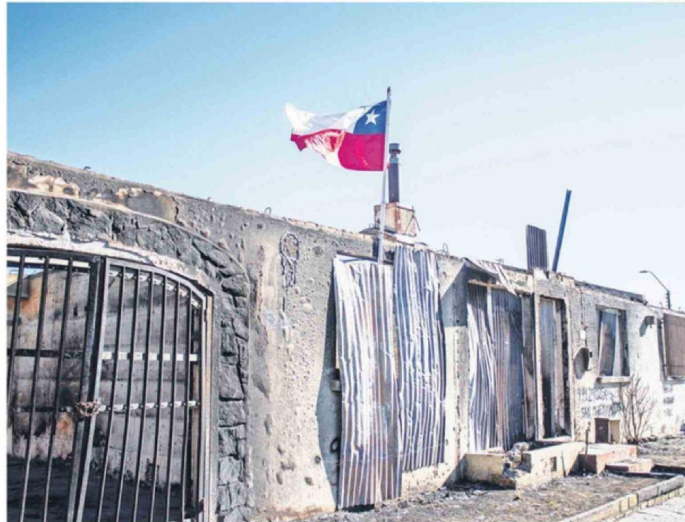
HAY MUCHOS SITIOS EN RUINAS QUE SON USADOS POR LOS DELINCUENTES PARA OCULTARSE

Además recaló que "Igualmente nos hemos organizado un poco para hacer rondas nocturna