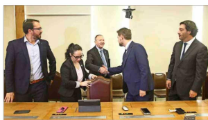
En un momento de la reunión, el PS optó por interrumpir el diálogo.

después de la reunión, la bancada del Frente Amplio emplazó al ministro García Rumínot a sostener una reunión, considerando que ha privilegiado las conversaciones con los sectores "más al centro" de la oposición, especialmente el PPD y la DC. El FA, a su vez, presentó un documento con medidas a tomar en cuenta para el proyecto, lo que incluye la creación de una mesa que se pronunciará sobre las partes de la iniciativa susceptibles de prosperar.