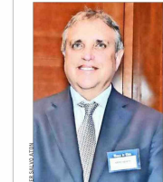
Andrés Ergas es el nuevo embajador de Chile en Washington.