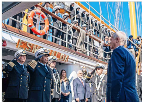
El Presidente José Antonio Kast visitó el buque escuela "Esmeralda", en la artesanal del anuncio de la iniciativa.

El cambio de estrategia es directamente atribuido a la dupla política de La Moneda: los mi-