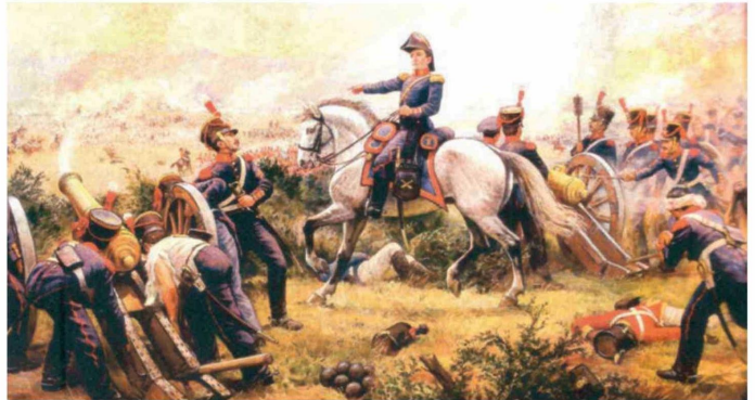
El coronel Borgoño dando instrucciones precisas a sus artilleros en la Batalla de Maipú. Sus disparos precisos fueron decisivos en el triunfo patriota.