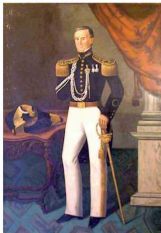
Retrato al óleo del General de división Domingo Urrutia Vivanco. Colección del Museo Histórico Nacional.

Participó en las batallas de El Quilo, Tres Montes y Quechereguas, donde fue ascendido a capitán, grado con el que peleó en Rancagua (1 y 2 de octubre de 1814). Como edecán de O'Higgins lo protegió celosamente durante el temerario asalto con el cual el prócer rompió el cerco realista, y cuando el caballo del héroe cayó en una trinchera, el capitán Urrutia le cedió el suyo para que pudiese huir a Mendoza, salvándole la vida. En el exilio allende