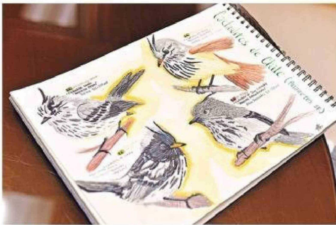
Los cachuditos en sus diferentes tipos.