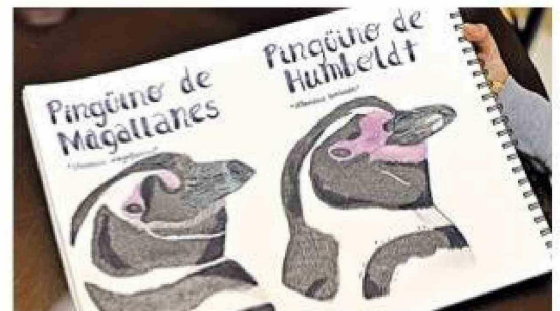
En cada dibujo utiliza distintas técnicas.

Entre sus especies favoritas menciona el tucuquero, el carpintero magallánico y el picaflor chico. "Me gustan todos", asegura.