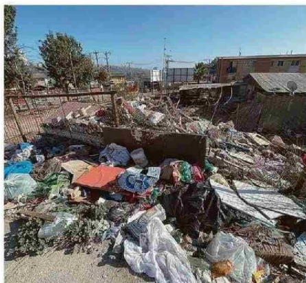
VECINOS BUSCAN UNA SOLUCIÓN AL MICROBASURAL.

ceño, integrante del comité del condominio Brisas del Mar, indica que: "Hay detalles, por ejemplo donde yo vivo se terminó todo, pero hay detalles. Hay propietarios que ellos han hecho los arreglos... Los vértices de mi cocina están todos abiertos. Yo te digo, va a venir un solo remezón y se va a venir todo abajo... Eran terminaciones que deberían haberla hecho ellos".