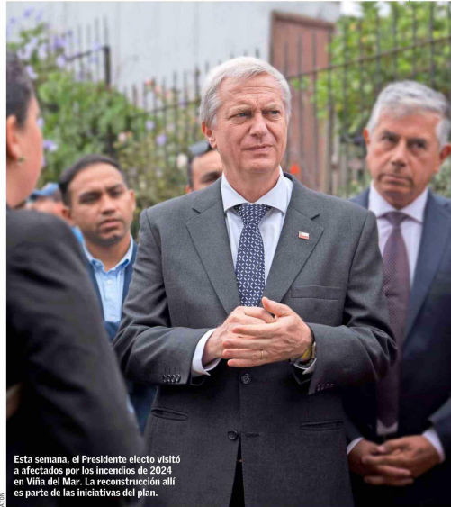
Esta semana, el Presidente electo visitó a afectados por los incendios de 2024 en Viña del Mar. La reconstrucción allí es parte de las iniciativas del plan.

En la misma línea, el "Desafío 90" dice que se deben iniciar los procesos de compras para disponer de mayor tecnología para el control de las fronteras (como drones y obstacu-