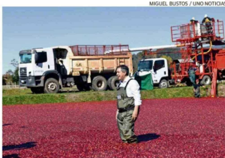
MIGUEL BUSTOS / UNO NOTICIAS