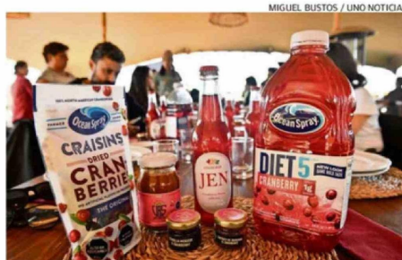
MIGUEL BUSTOS / UNO NOTICIAS