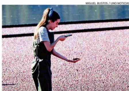
MIGUEL BUSTOS / UNO NOTICIAS