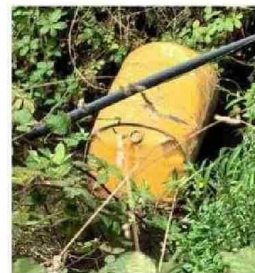
URBANISTAS PONIENTE CON MONTE BLANCO