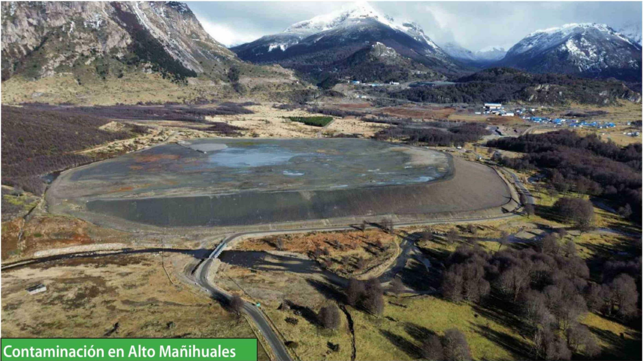
Contaminación en Alto Mañihuales