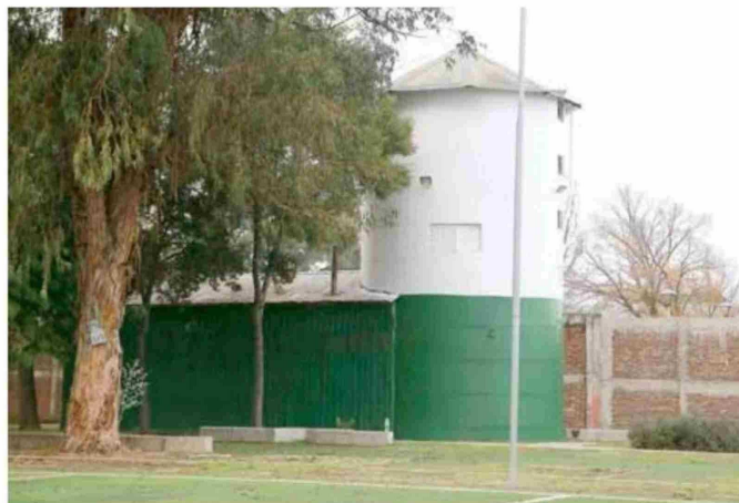
Como un presagio, en el recorrido, las autoridades se encontraron con una infraestructura pintada con los colores institucionales de Carabineros.