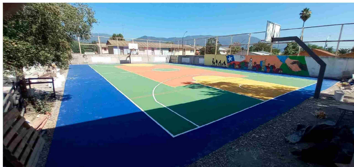
Escuela El Amanecer de lo Moscoso de Placilla.

invertir directamente en las trayectorias educativas de nuestros estudiantes, en su bienestar diario y en las oportunidades que tendrán a lo largo de su vida escolar, permitiendo que desarrollen todo su potencial" señaló. @