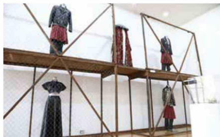
Parte del dispositivo escénico de la obra "Ricardo III", que forma parte del castillo, que unida a otras estructuras asemeja una cárcel contemporánea, sumada a grandes vestuarios empleadas por los actores.

la cual se hace una rehabilitación e inclusión de estas personas que están privadas de libertad. Tanto está como otra exposición que inauguramos de manera simultánea, estarán expuestas durante todo el mes de mayo y parte del mes de junio, así que una invitación a que puedan visitar el Centro de Extensión de la Universidad de Talca.