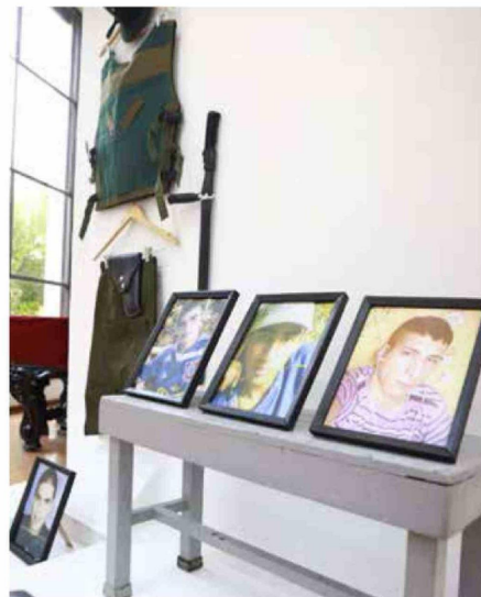
En otro de los módulos denominada "Torre 5" del 2013, se aborda la tragedia más grande generada en una cárcel, ocurrida el 8 de diciembre de 2010, en San Miguel, donde fallecieron e de 81 internos en un incendio.

REÚNE 15 AÑOS DE HISTORIA, MEMORIA Y TRANSFORMACIÓN DE CORPORACIÓN DE ARTISTAS POR LA REHABILITACIÓN