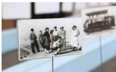
En esta imagen se ven algunos de los actores que, a través del teatro, lograron rehabilitarse y conectar con el mundo nuevamente a través del arte.