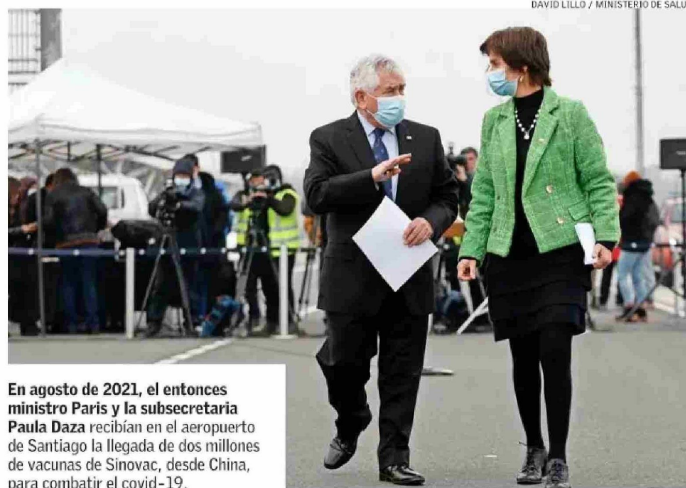
En agosto de 2021, el entonces ministro Paris y la subsecretaria Paula Daza recibían en el aeropuerto de Santiago la llegada de dos millones de vacunas de Sinovac, desde China, para combatir el covid-19.