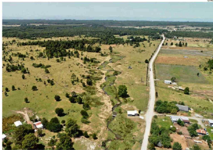
EL SITIO ARQUEOLÓGICO ESTÁ UBICADO CERCA DE PUERTO MONTT EN LA REGIÓN DE LOS LAGOS.