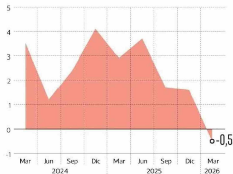
En var % anual trimestral