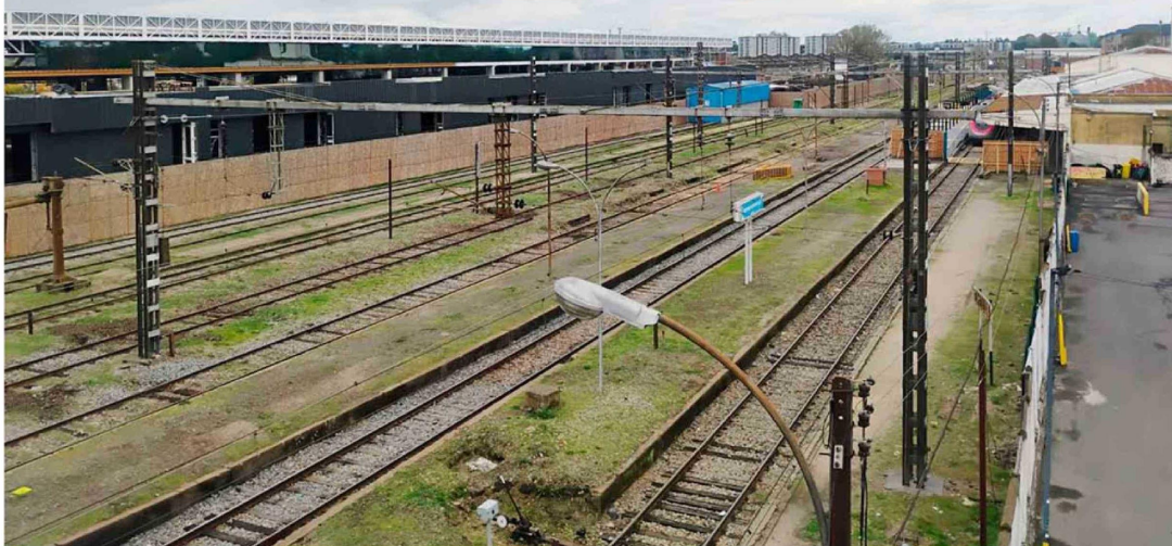
La estructura gruesa que es perfectamente fácil de advertir desde muchas calles del sector Ultraestación.

En la empresa explican que por problemas de ingeniería, la obra se ha atrasado en sus plazos que originalmente concluían en julio del año pasado. Edificio permitirá la modernización y mejoramiento de andenes para las estaciones de todo el tramo Rancagua-Chillán.